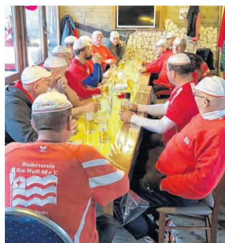
In der Freyburger „Weintraube“ wird die Mittagspause gesellig verbracht. Die Wanderer schießen ein Selfie.

» Verein im Internet unter der Adresse www.ruderverein-naumburg.de